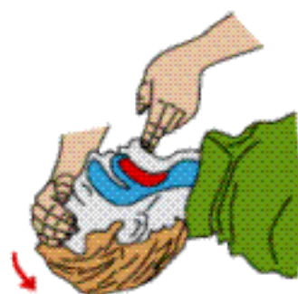
Uvolni dýchací cesty